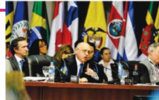
El canciller argentino Héctor Timerman habla en la 42ª reunión de la OEA, en el 2012.

En primer lugar, todos los países de América del sur han ratificado su apoyo al reclamo argentino, como se expresó en reuniones del Mercosur y la Unasur. Además, la Organización de Estados Americanos (OEA) y Comunidad de Estados Latinoamericanos y del Caribe (CELAC)