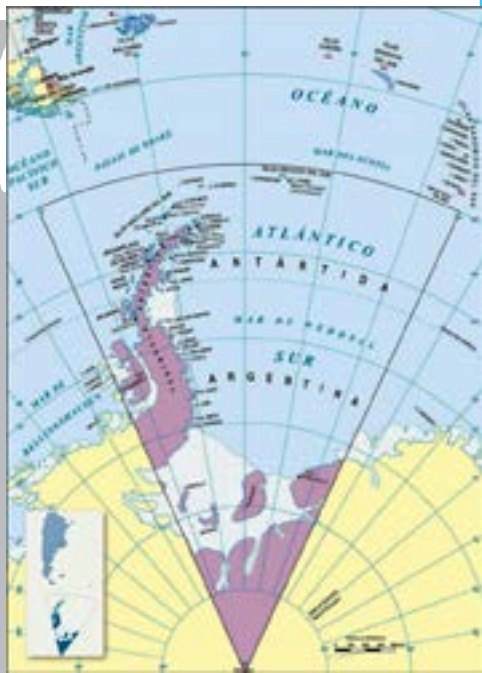
Mapa del espacio del Atlántico sur sobre el que la Argentina reclama soberanía plena.

Otro aspecto importante de la cuestión geográfica es que Malvinas se encuentran a menos de 2.000 kilómetros de Buenos Aires y a más de 13.000 de Londres, la capital británica.