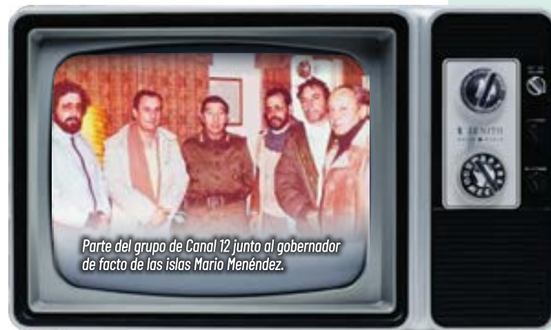
Parte del grupo de Canal 12 junto al gobernador de facto de las islas Mario Menéndez.